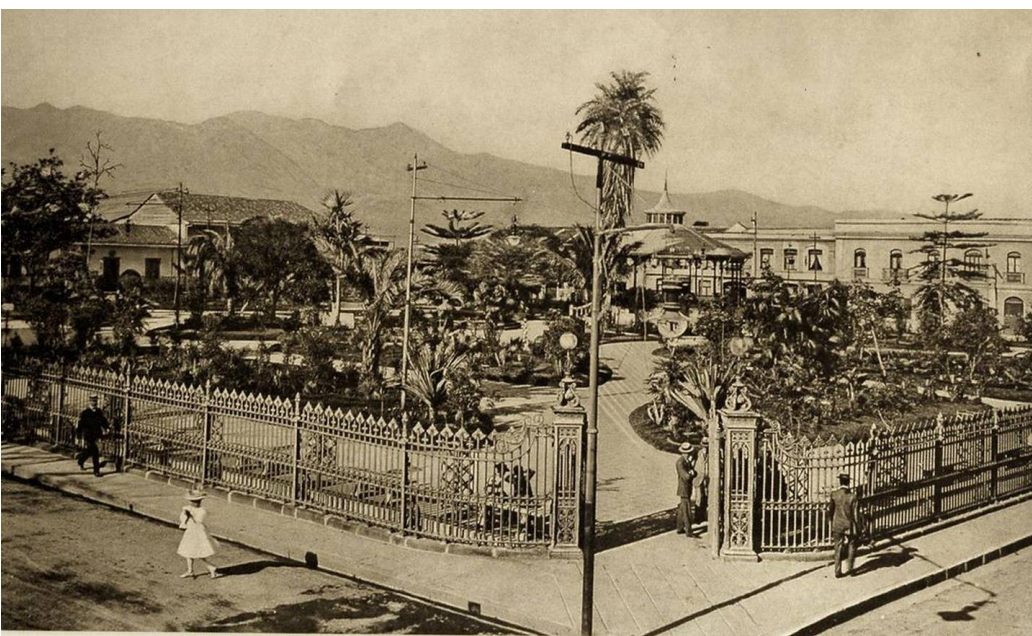
Fotografía #1, Parque Central de San José en 1909 (ver fuentes consultadas)

Pues la compañía transportadora dejó las verjas en Puntarenas, Costa Rica , desde donde, en carretas, se procedió a transportarlas a San José.