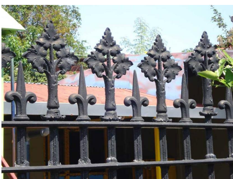
Fotografía #3, segmento de la verja en el jardín de niños de la escuela Pedro Aguirre Cerda, de San Pedro de Poás (ver fuentes consultadas)

Durante la tercera administración (1932-1936) de don Ricardo Jiménez Oreamuno, se construyó el nuevo edificio para la escuela de San Pedro de Poás, en donde se utilizó parte de esa baranda, edificio que en la actualidad ocupa la Casa de la Cultura de San Pedro de Poás.